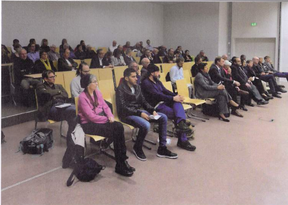
Abb. 2 Das Publikum (Ausschnitt) beim 13. Dialog ADS-Grenzfriedensbund